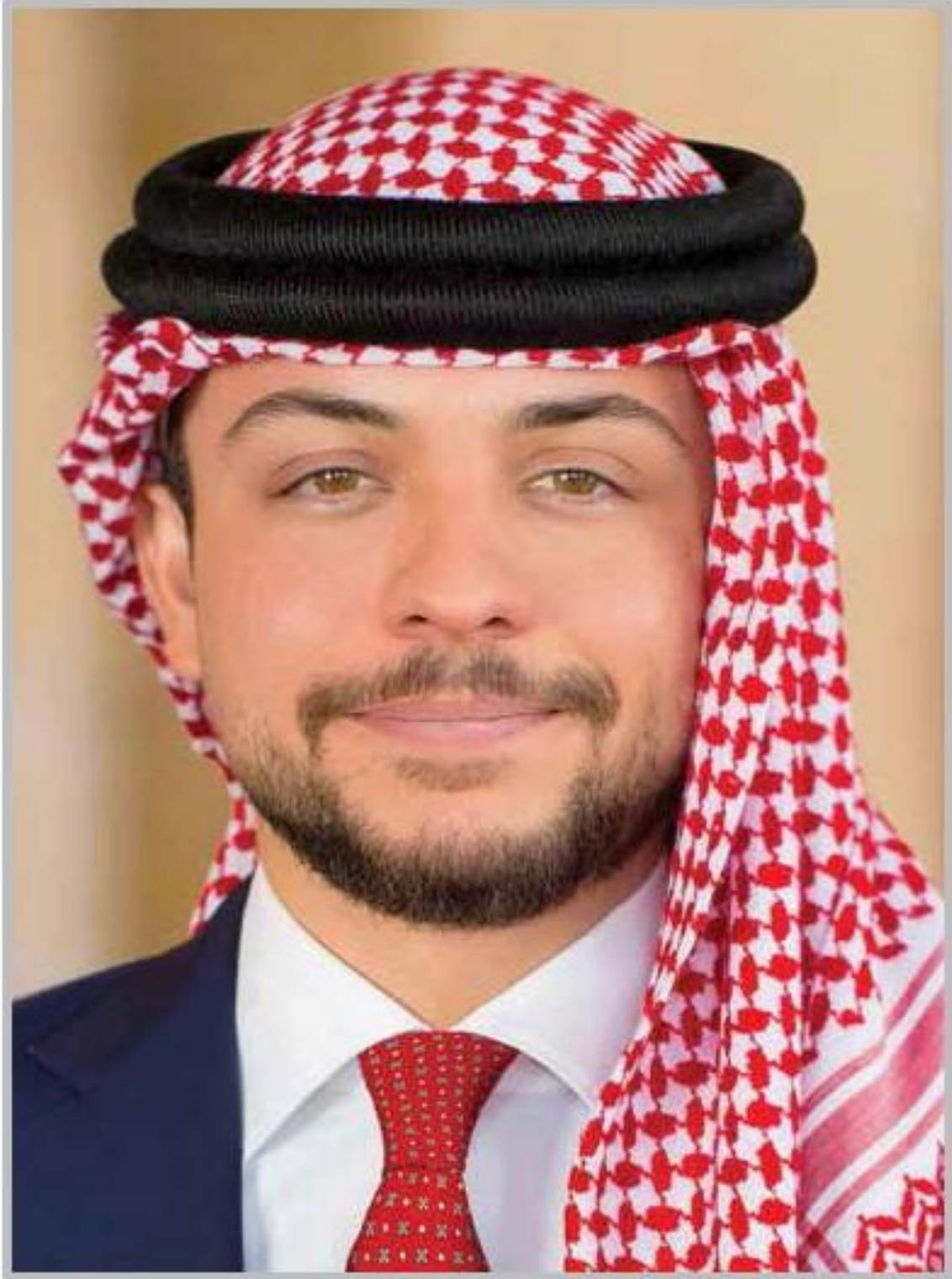
حضرة صاحب السمو الملكي ولي العهد الأمير الحسين بن عبد الله الثاني المعظم